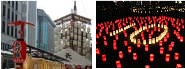
近隣の夏祭り(奈良女子大学メールマガジンより抜粋)

立秋を過ぎてはまだなお暑く、マスコミ各社は北海道や高原から「秋のおとずれ」を捻出して報道していただきますが、実感がないのが現状ですね。無理をせずにがんばっていこうと思います。