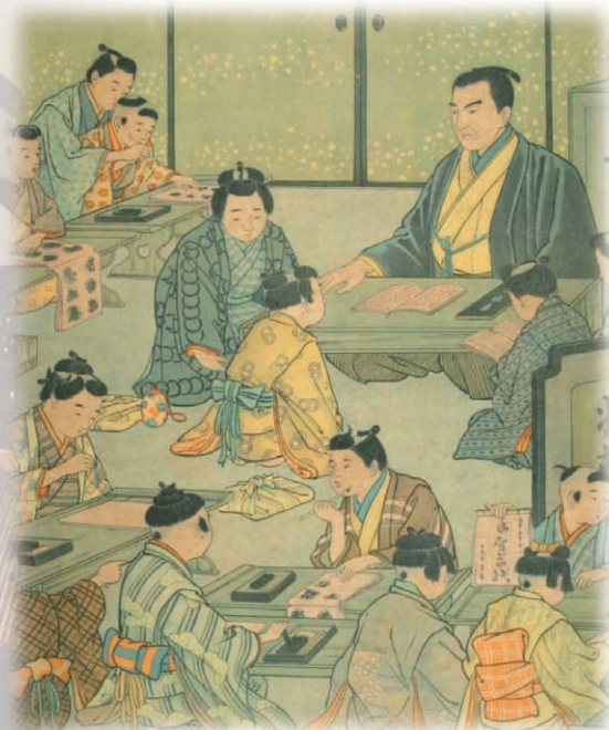
「明治教育文庫」より 教育用掛図(徳川時代寺子屋ノ図)