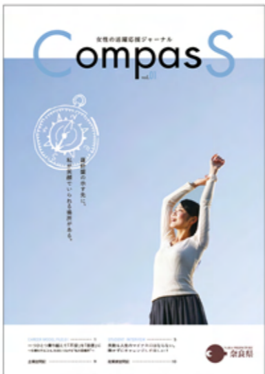
奈良県発行のジャーナル「Compass」 →奈良県庁ホームページでご覧いただけます

私は奈良県出身ではありませんが、すでに今までの人生の約3割も年月を奈良で過ごしています。内側からみた奈良の良さも、外側からみた奈良の良さも感じていまして、これから、まだまだ私の知らない奈良も発見できることでしょうか。暮らしや仕事において、「私は奈良でもっと色々なことができるぞー」と思っています。奈良女子大学を目指す高校生の皆さん、奈良は素敵なおとこです。卒業生の皆さん、いつでも奈良へ帰ってきてください。