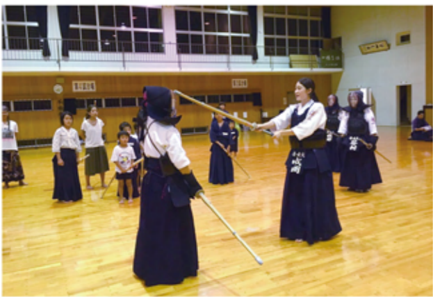
川上村剣道教室での指導の様子

私たち剣道部は、強く、賢く、美しく、をモットーに日々稽古に励んでいます。剣道部の魅力は、経験歴や実力に関わらず、「剣道が好き！」という気持ちがある人なら誰でも一生懸命、稽古に打ち込めることです。現在部員は3回生が6名、2回生が2名、1回生が2名と少人数ではありますが、それがゆえ、部員同士の距離が近く、先輩や後輩の壁を越えてお互いにアドバイスをし合い、切磋琢磨することができます。