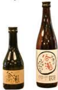
完成した純米酒「谷瀬」