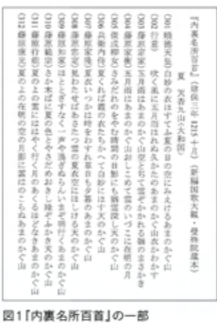
図1「内裏名所百首」の一部