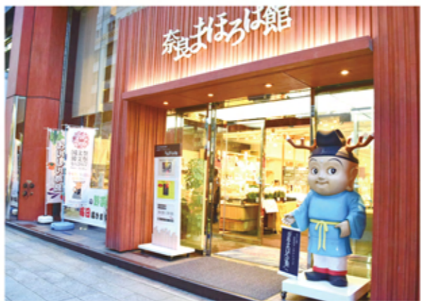
奈良女の講座も開催しているアンテナショップ「奈良まほろば館」

そして現在、私は大好きな奈良に関わる仕事に就き、3月までの3年間は、念願の首都圏における奈良県のPRに携わりました。都内の旅行会社や出版社を1人で訪問する際には、プレッシャーも感じましたが、自分が提供した情報が旅行商品やメディアを通じて何千、何万もの人に伝わっていくことに大きなやりがいを感じました。また、勤務場所であったアンテナショップ（奈良県の特産品を販売するショップと観光情報コーナーを併