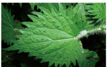
シカに対する防衛として多数の刺毛を備えた奈良公園のイラクサ

シカに関する現状の問題は何ですか シカは日本全国で急速に頭数を増やしています。シカはとても食い意地の張った草食動物で、木の芽や若木を食べたり、木の皮までも食べたりするので、頭数が増えると生態地の生態系を大きく変化させてしまうのです。実際、春日山の原始林も荒廃し始めています。シカ自身も問題を抱えていて、奈良公園のシカは食糧不足で、他の地域のシカと比べて痩せ気味と言われています。