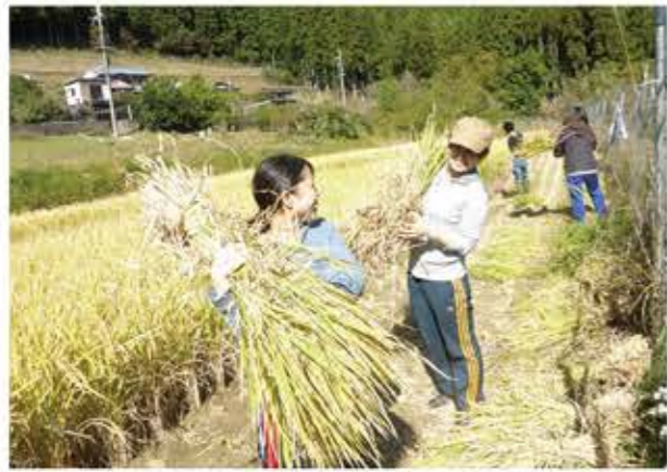
谷瀬で酒米の収穫を行う様子

——谷瀬集落の酒造りに関わるようになったきっかけを教えてください—— もともと酒造りが始まる前から、私たちは谷瀬集落の地域づくりに研究室として関わりを持っていました。村の方々が休耕田を見ながらおっしゃった「昔はたくさんお米を作っていたんだけど、今は高齢化が進んで使っていない田んぼが多くある。本当はそこに酒米を植えてお酒なんかを作れたらいいんだけどね。」という冗談のような話から始まりました。そして、学生の参加協力があれば、問題となっている人手不足も解消できそうだとということで、酒造りが始まったんです。今年で二年目になりますね。