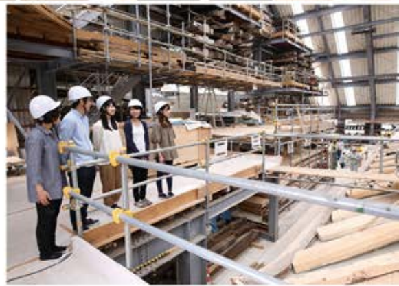
表紙写真: 称念寺(奈良県橿原市)の解体現場にて