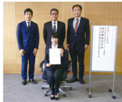
平成29年度「環境機器奨学金」 奨学生採用決定通知書授与式

今後も学生に質の高い修学環境を提供すべく努力してまいりますので、引き続き、更なるご支援を賜りますようお願いいたします。