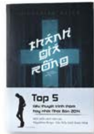
タイトル: Thanh gia rong 出版社: SkyNovel & NXB Hoi nha vac 著者: 東野圭吾 (Higashino Keigo)

ナム語にもあり、そこではさほど苦勞しませんでした。一方で翻訳するのに一苦勞なのは、漫画ですね。日本と言えば漫画文化ですが、漫画は文字数が限られ、擬音語がたくさん出てくるため、小説よりも翻訳の難易度が高いです。どうしても翻訳できないもの、例えば、日本固有の文化に由来するものや表現については、日本語を使い、注で補足します。