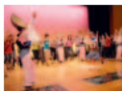
阿波おどり会館にて