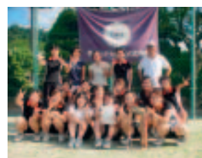
初優勝を飾った硬式テニス部

近畿地区の国立大学において、学生の課外活動の健全な発展を図るとともに相互の親睦に資することを目的とした「近畿地区国立大学体育大会」が毎年8月に開催されています。第45回目の今年度は大阪教育大学を当番大学として8月7日(火)～25日(土)に開催され、熱戦が繰り広げられました。