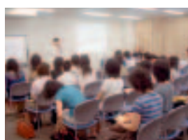
同窓会からの活動紹介

8月4日(土)東京都内で初めて、高校生等入学希望者向けの大学単独の説明会を開催しました。「奈良県代官山i(アイ)スタジオ」を会場に、都内及び周辺各県、遠くは新潟県や静岡県の高校生及び保護者の参加がありました。