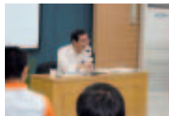
弦巻教授の講義風景

★9月17日(月)～9月26日(水) 岩崎生活環境学部教授が学生2名を同道し、蘇州大学で服飾史について講義を実施しました。