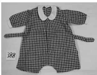
奈良女子大学の裁縫教材研究

奈良女子大学には、前身である奈良女子高等師範学校以来の長い被服教育の歴史があり、多くの教材や作品が残されています。昭和初期頃(一部戦後)までを対象に、実物と同じデザインと縫い方で寸法のみ縮めた裁縫雛型、パーツ縫いや仕末法を伝授するための見本教材、素材研究や教材入手のための布見本や糸見本などを展示しています。